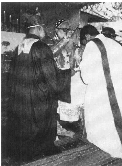
FIG. 2.4 – L'évêque coupe quelques cheveux du candidat.

Chaque ordination contient aussi un renoncement au monde. C'est pourquoi l'évêque ordonnant coupe quelques cheveux du candidat sous forme de croix. Les cheveux coupés lors d'une ordination sacerdotale sont conservés jusqu'à la mort du prêtre puis ils sont brûlés (figure 2.4 page 16).