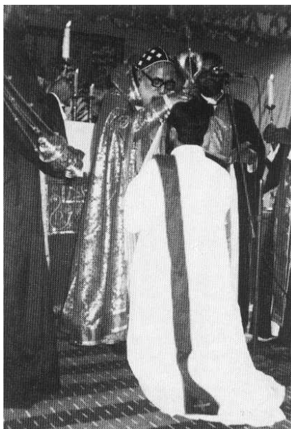
FIG. 2.3 – Le métropolitaine ordonnant souffle trois fois sur le diacre.