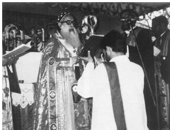
FIG. 2.1 – L'Évangile lu par le ministre de l'ordination.