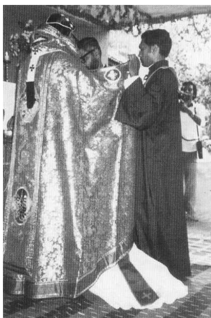
FIG. 2.5 – La véritable rite d'ordination commence.

Le diacre est prié de s'approcher de l'autel qui autrement est réservé au célébrant. A présent commence le véritable rite d'ordination avec la prière de l'imposition des mains (figure 2.5 page 17). Un prêtre assistant cache le candidat à l'ordination avec l'habit de l'évêque officiant pendant que ce dernier prononce les paroles d'ordination : « Dieu grand et admirable... Vous élevez dans toutes les générations vers ce saint ministère ceux qui vous plaisent ; choisissez votre serviteur ici présent comme prêtre et laissez-le recevoir, avec des mœurs irréprochables et une foi inébranlable, le grand don de votre Saint-Esprit pour qu'il soit digne de servir la bonne nouvelle de votre Royaume, de rester debout devant votre saint autel pour sacrifier des oblats physiques et spirituelles, de renouveler votre peuple par le bain de la re-naissance, de montrer l'épée de la lumière de votre Fils unique. » L'acte de l'ordination reste caché aux yeux des croyants. Ce qui se passe est une oeuvre, un mystère de la foi qu'opère l'Esprit de Dieu. C'est pourquoi les croyants prient durant toute l'épiclese ( ici la prière d'ordination ) : Kyrie eleison .