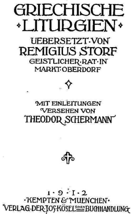
FIG. 2.7 – Couverture Sal Terræ , 1912.

mis en avant, dans un exposé devant les anglicans qui a été publié dans le TABLET , l'analogie entre la décision Addai-Mari et la reconnaissance des consécrations épiscopales anglicanes. Dans cet esprit est apostolique tout ce qui correspond au concept talmudique et synodal des prétendus décrets des apôtres, et là, un Concile de Nicée et tous les autres Conciles ne peuvent que heurter. Il faut donc un Concile qui se rattache à « l'esprit de Jérusalem ».